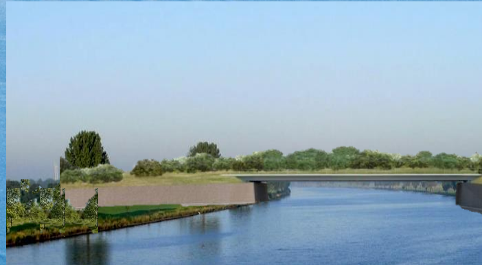
Boven: Ecoduct over de Maas Links: Schematische tekening van verticale landbouw en de geluidswallen die ingezet kunnen worden