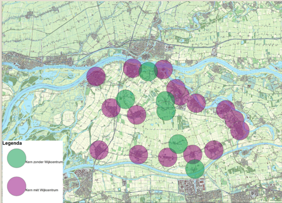
De 16 complete kernen met wijkcentrum (paars)