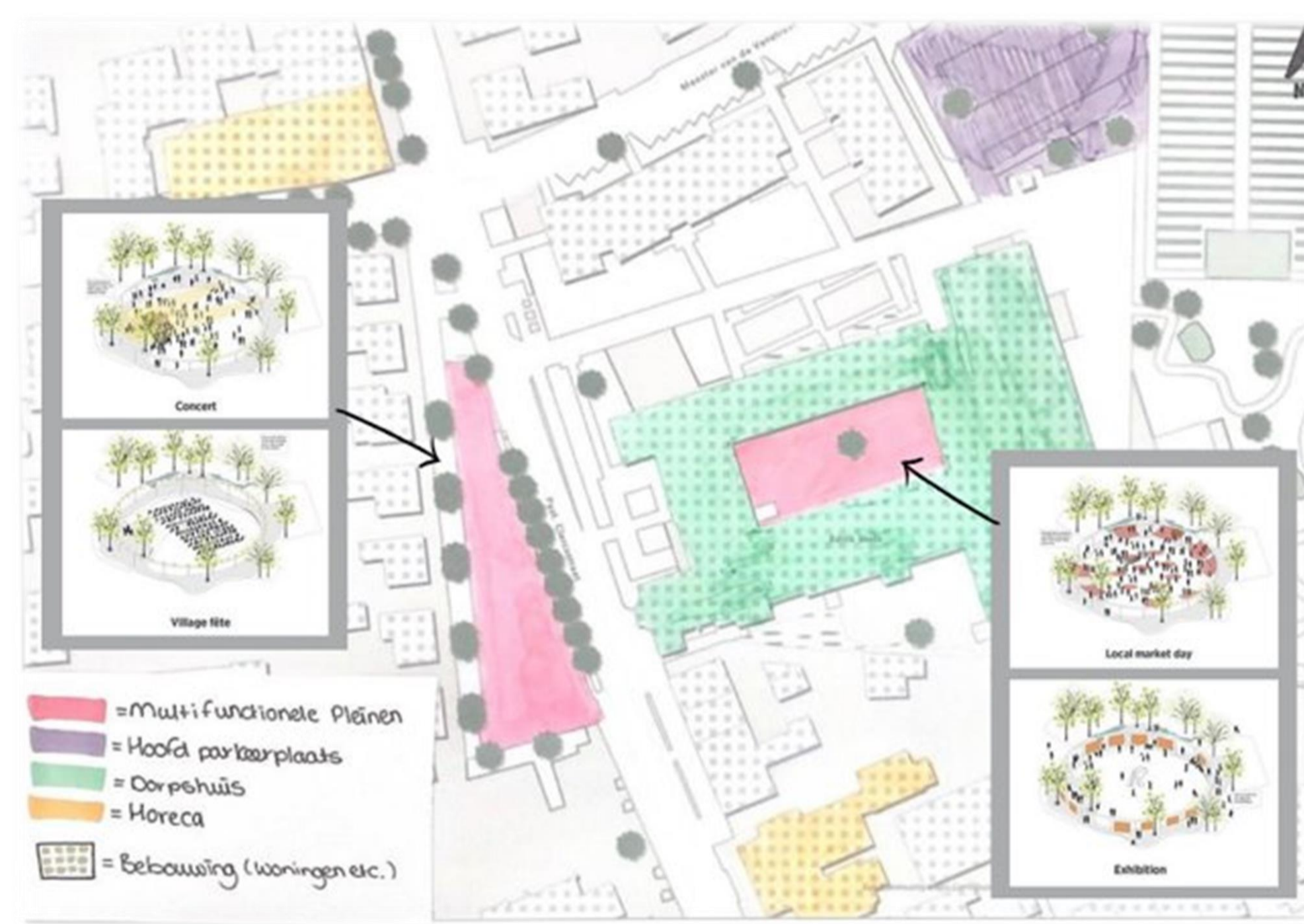
Figuur 11: Detailuitwerking nieuwe centrum Zijtaart

Een wijk waar plek is voor jong en oud met de mogelijkheid om door te schuiven binnen de woningen die er zijn wanneer mensen in een andere levensfase komen.