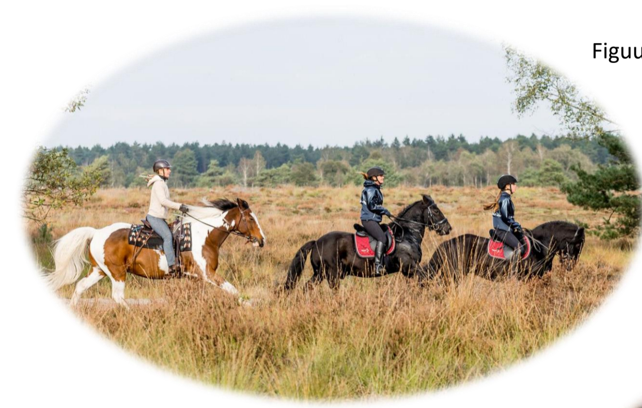
Figuur 8: Sfeerimpresie ruiterspaden