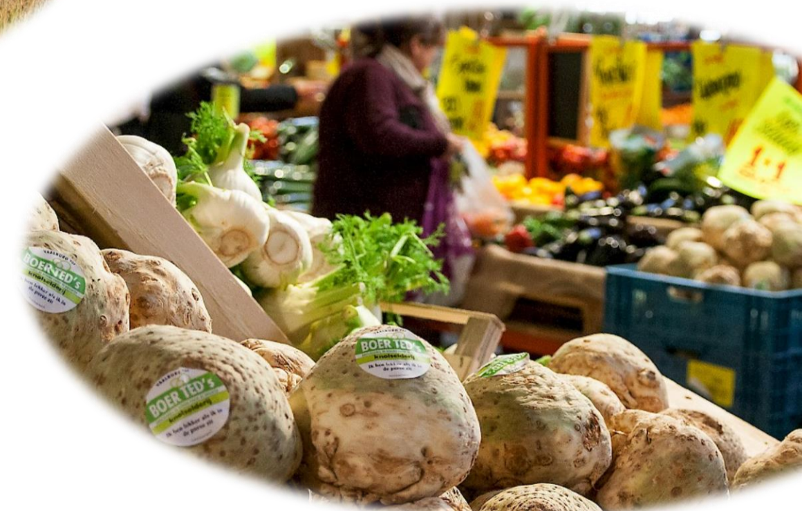
Figuur 9: Lokale voedselproductie d.m.v. extensieve landbouw