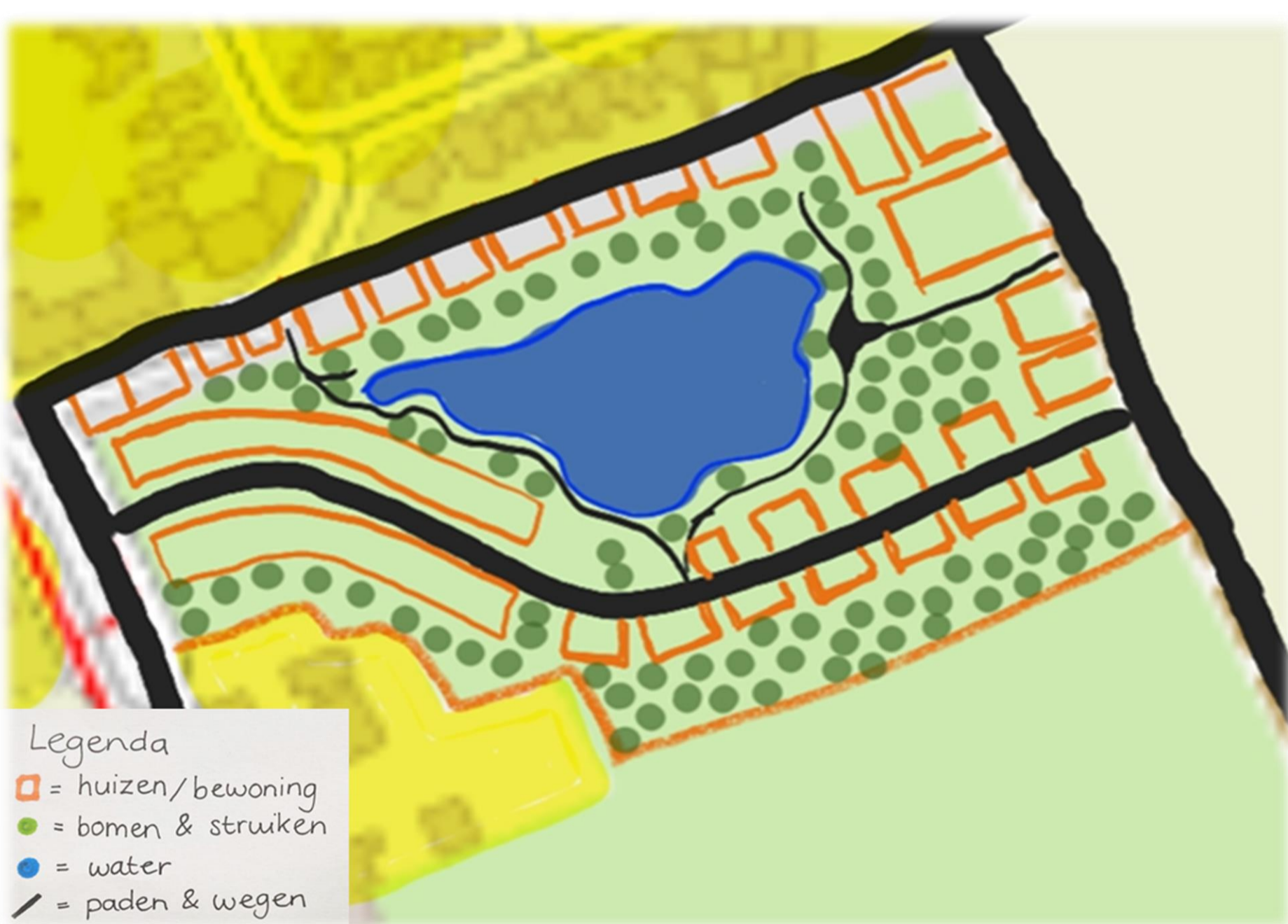
Figuur 10: Detailuitwerking nieuwe woonwijk Zijtaart

Een wijk waar plek is voor jong en oud met de mogelijkheid om door te schuiven binnen de woningen die er zijn wanneer mensen in een andere levensfase komen.