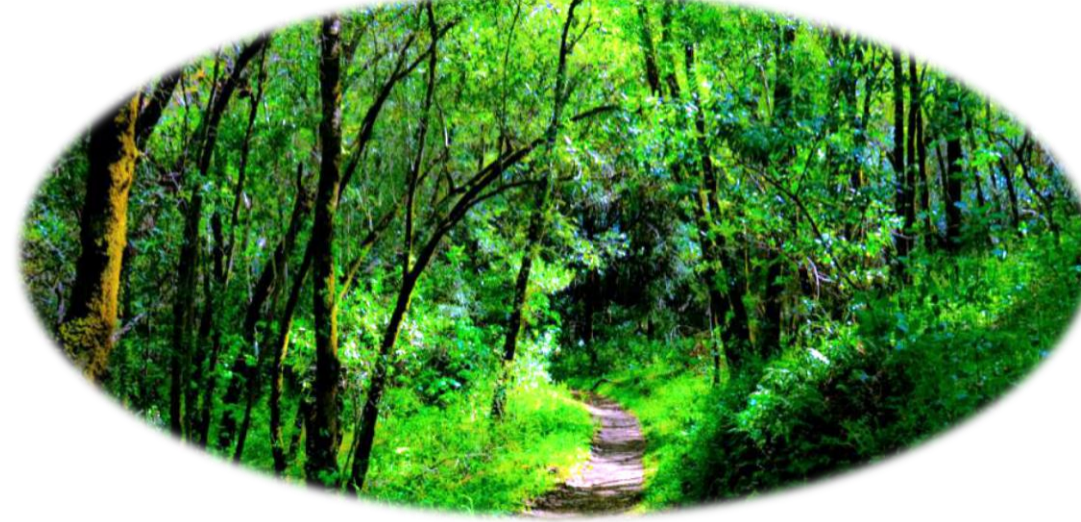
Figuur 2: Sfeerimpresie bos