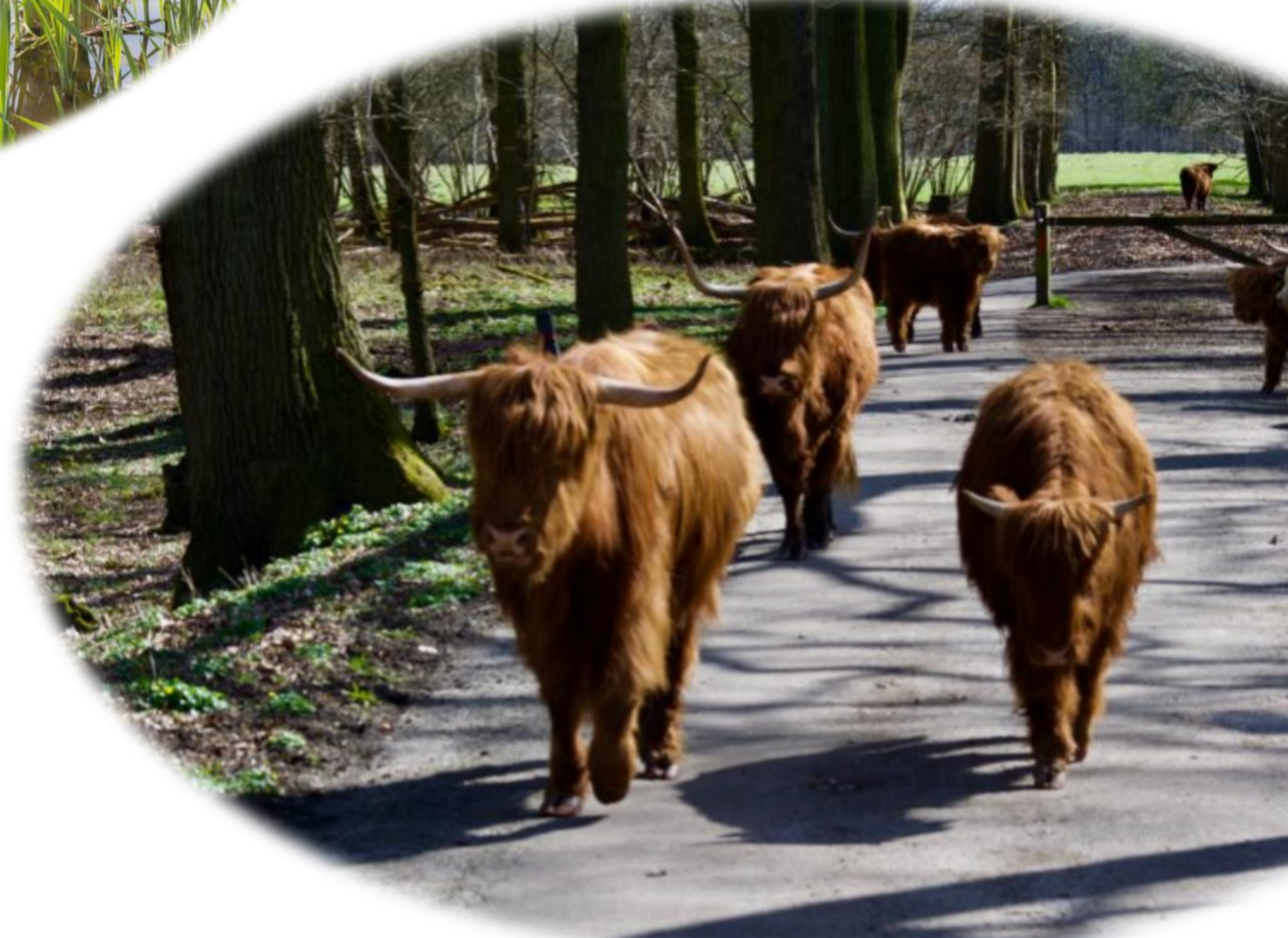
Figuur 7: Sfeerimpresie Schotse Hooglanders in het bo