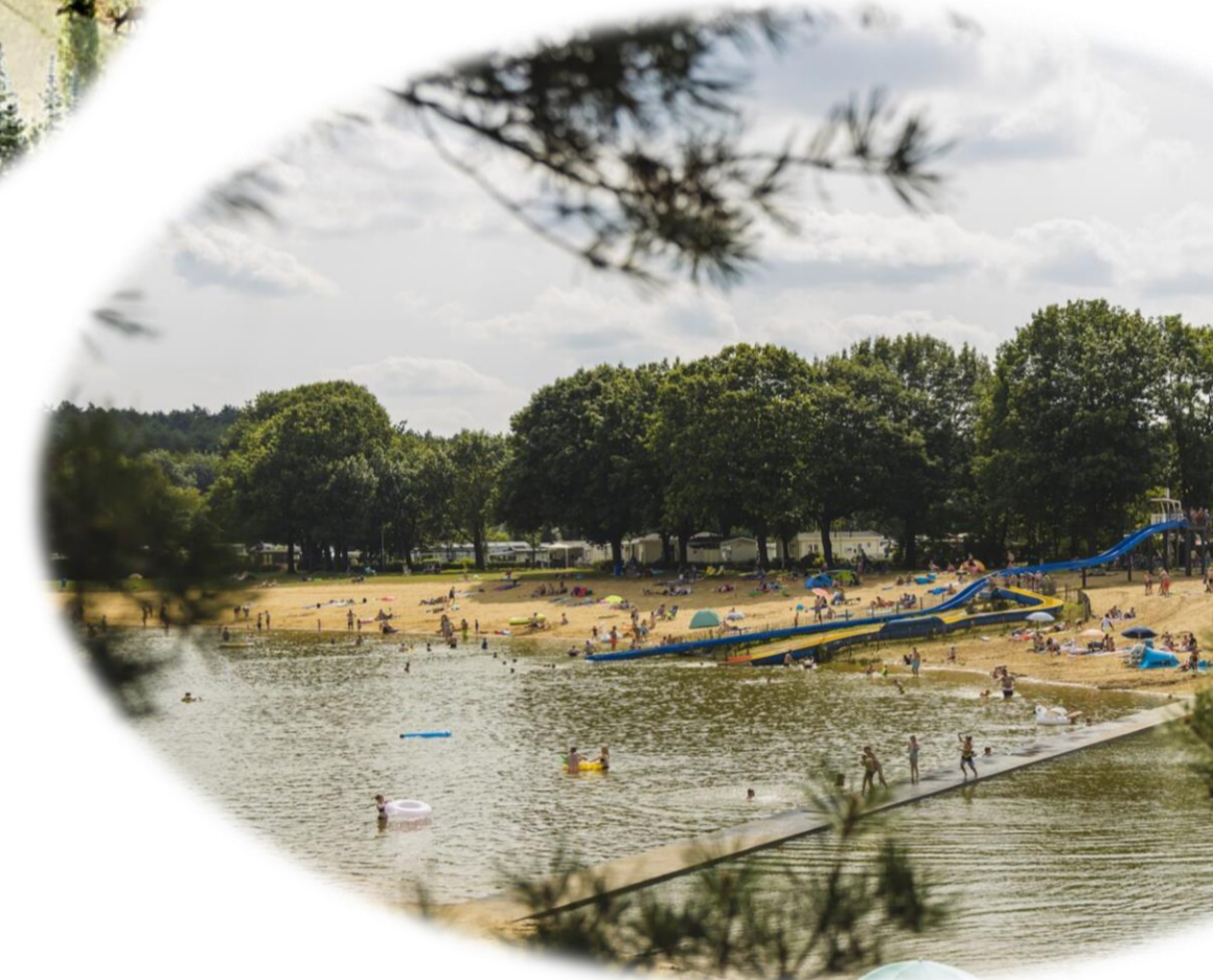
Figuur 5: Sfeerimpresie recreatieplas