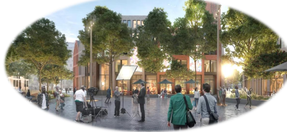
Figuur 3: Sfeerimpresie levendige kern