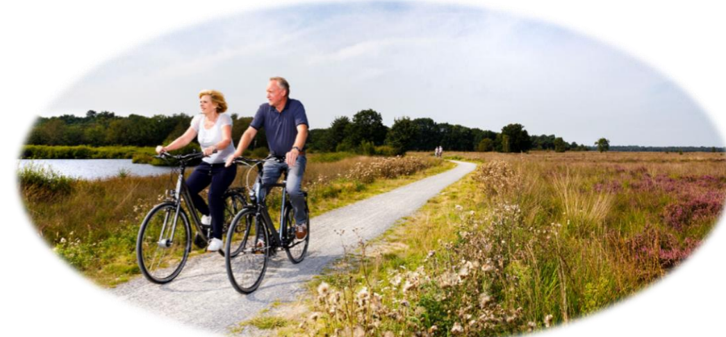
Figuur 1: Sfeerimpresie fietsroutes door natuurgebied