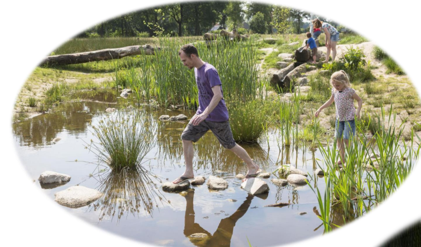
Figuur 6: Sfeerimpresie natuurspeeltuin ten midden van retentiegebied